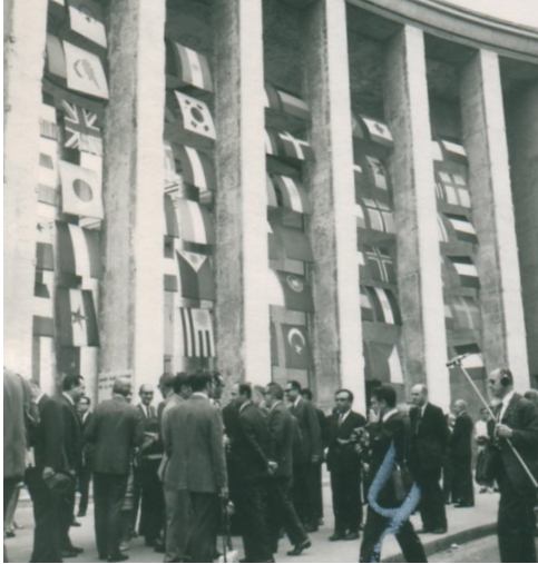
Samy Poliatchek, inauguration de la 5 e Biennale de Paris, 1967

24 octobre 2017 INHA, salle Giorgio Vasari, 17H - 20H