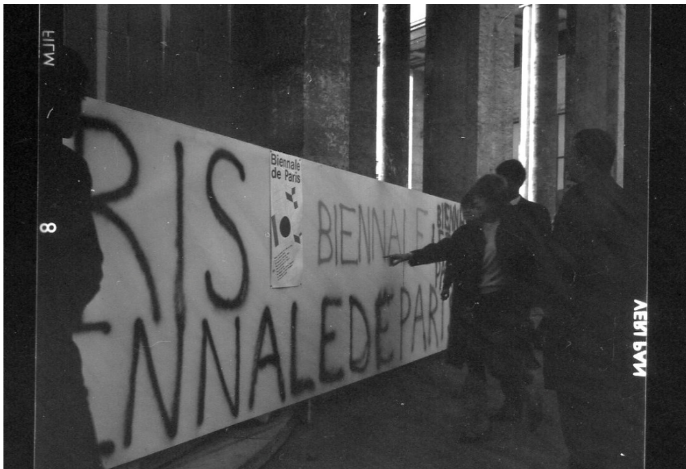
Robert César, Biennale de Paris, 1965, vue d'extérieur.