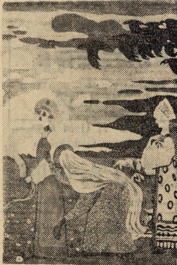
KANDINSKY : Corbeaux (1907).